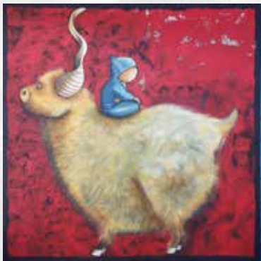
(acryl op doek, 90 x 90 cm)