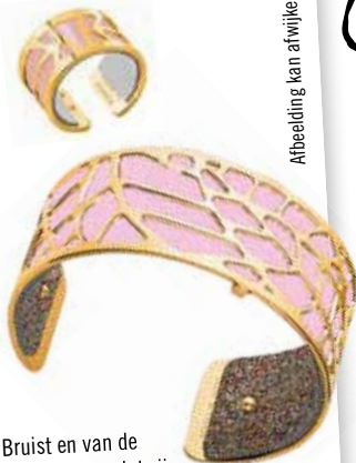
Afbeelding kan afwijken

Like de Facebookpagina van Nederland Bruist en van de glossy uit jouw regio. Share de actie met je vrienden zodat zij ook op de hoogte zijn van deze leuke lezersactie! Of stuur je gegevens o.v.v. 'Lezersactie#1 september naar prijsvraag@nederlandbruist.nl