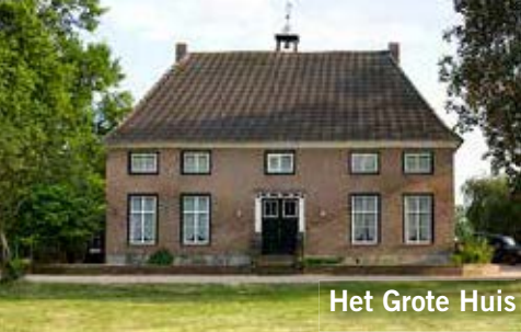
Het Grote Huis