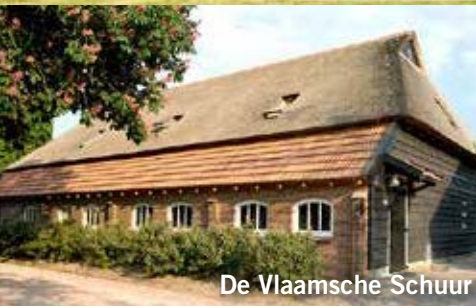
De Vlaamse Schuur