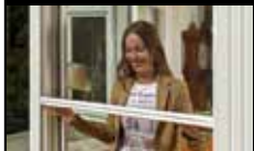
Deur- & raamrolhorren