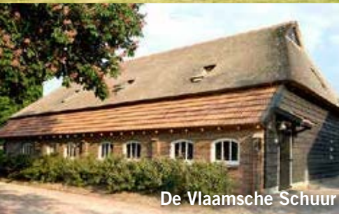
De Vlaamse Schuur