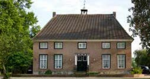
Het Grote Huis