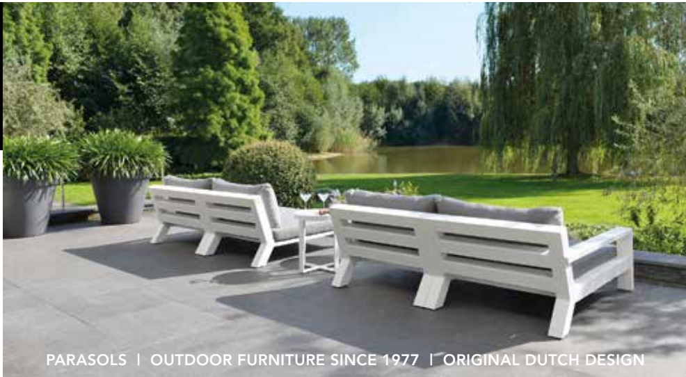
PARASOLS | OUTDOOR FURNITURE SINCE 1977 | ORIGINAL DUTCH DESIGN