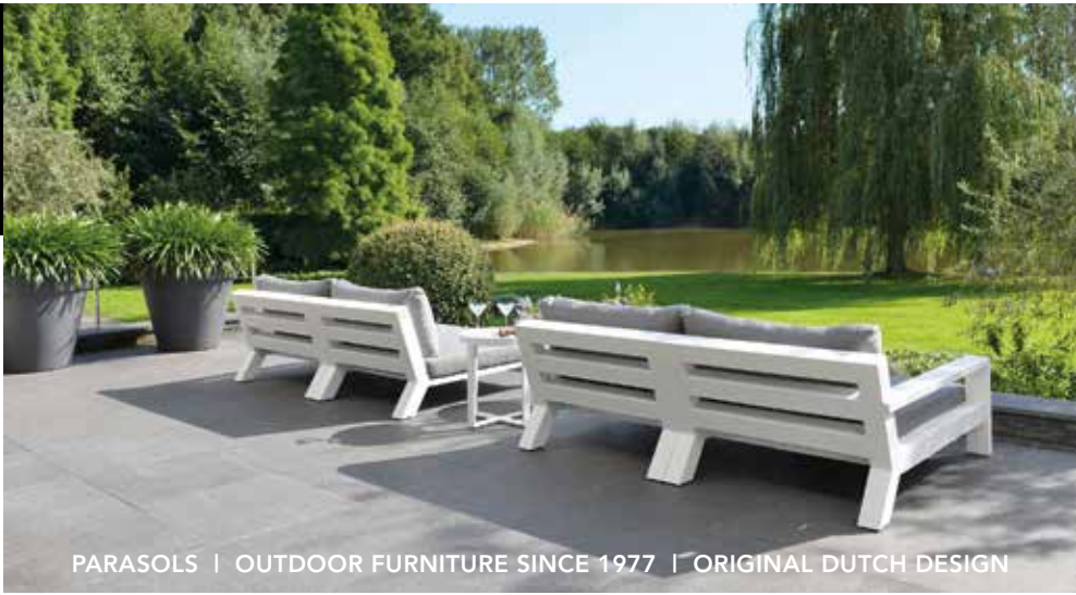
PARASOLS | OUTDOOR FURNITURE SINCE 1977 | ORIGINAL DUTCH DESIGN